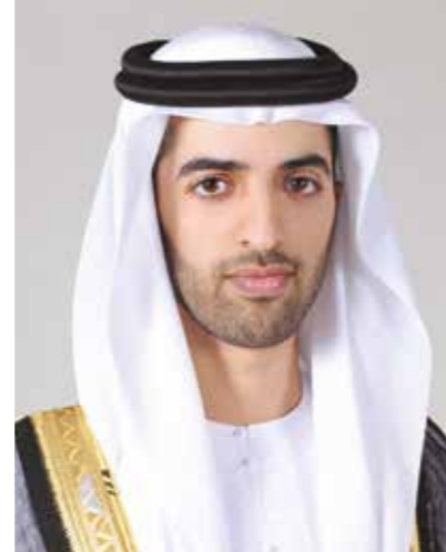
سمو الشيخ محمد بن سعود القاسمي ولي عهد إمارة رأس الخيمة