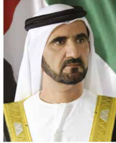
سمو الشيخ محمد بن راشد آل مكتوم نائب رئيس دولة الإمارات العربية المتحدة ورئيس وزراءها