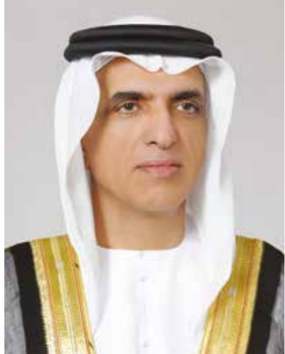
سمو الشيخ سعود بن صقر بن محمد القاسمي عضو المجلس الأعلى وحاكم إمارة رأس الخيمة