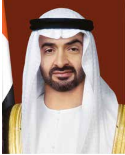
سمو الشيخ محمد بن زايد آل نهيان رئيس دولة الإمارات العربية المتحدة